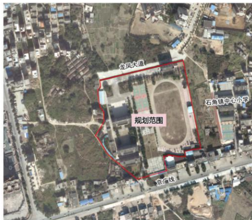
规划区在佛冈县的区位