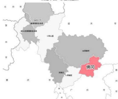
佛冈县在清远市的区位