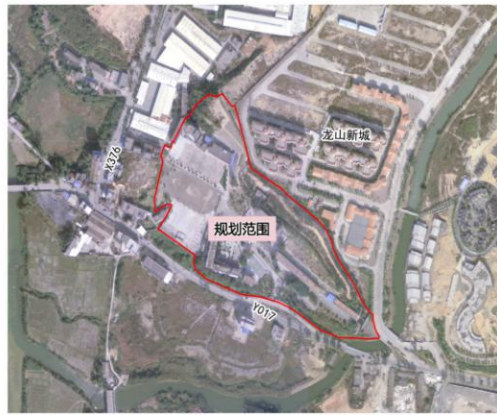
规划区在佛冈县的区位