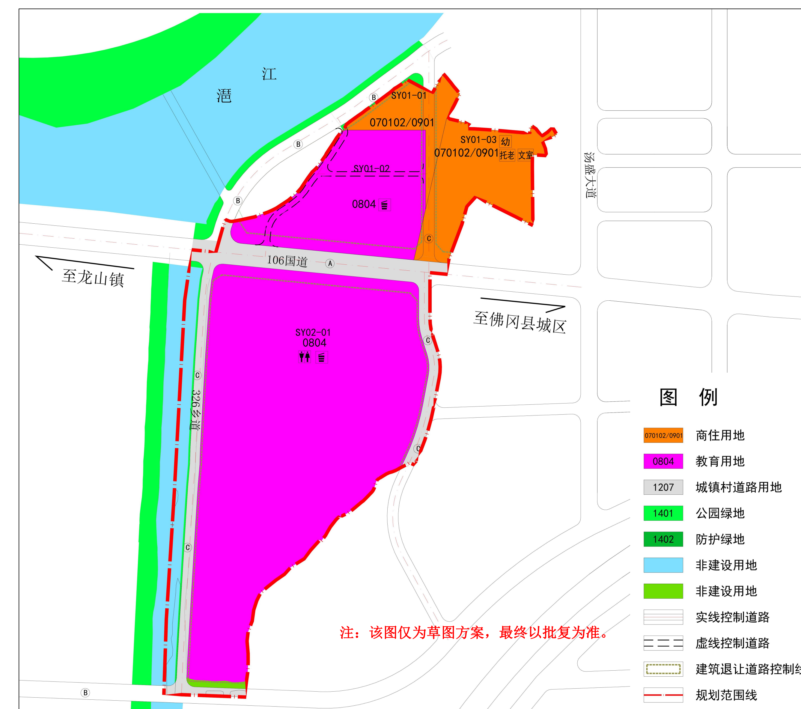
调整后土地利用规划图