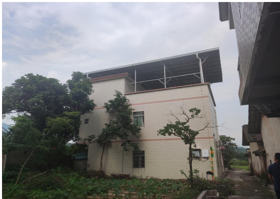
图 1 安装户用光伏电站的自建房外立面