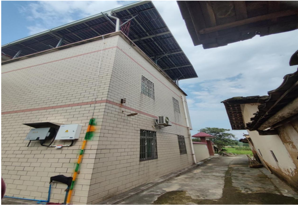
图 3 安装户用光伏电站的自建房侧面