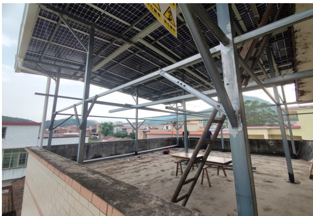
图 2 安装户用光伏电站的自建房二楼楼顶