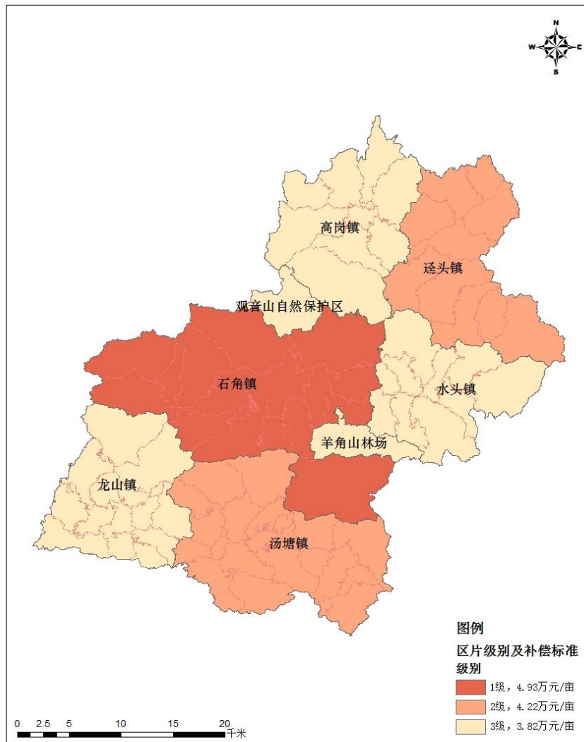
图1 佛冈县征收农用地区片综合地价区片分布图

结合佛冈县的实际情况，在现行征收农用地区片综合地价区片划分成果的基础上，采用均质区域调整法划分区片。本次2023年佛冈县征收农用地区片综合地价划分三个区片，与现行成果一致，结果如下：